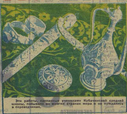
Эти работы, сделанные учениками Кубачинской средней школы, побывали во многих странах мира и не нуждались в переводах.

лы, и вы прочтываете и это стихотворение известного беларуского поэта, и это ут- ро 16 октября, когда в го- рах выпал первый снег. Вы увидите и услышите песню о Родине, о солнце, о дру- ге, о радости.